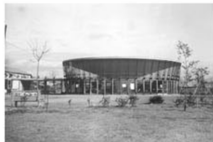
丹下健三氏設計 児童図書館の全景

このような生い立ちを持つ5-Days こども図書館（広島市こども図書館）は、今年5月、開館から40周年を迎えます。今も、誕生当初の「子どもたちのために」という願いを引き継ぎ、読書の機会を提供している同館へ、ぜひお越しください。