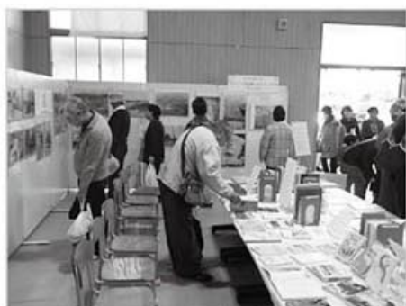
平成 30 年度図書館ブースの様子