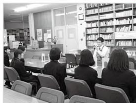
広島市立広島商業高等学校

生徒の皆さんにとって、将来や職業について考えるきっかけや、読書の楽しさを感じてもらえる機会となっているようです。