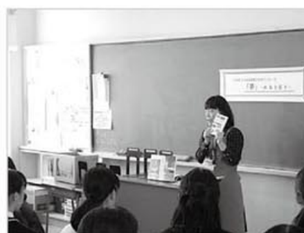
広島市立舟入高等学校