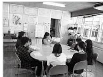
ふれあい教室・中での出前ブックトークの様子