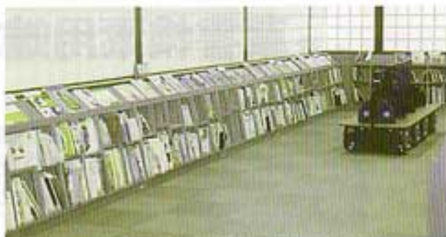
▲ 絵本のコーナー。表紙が見えるように並べられている。

子どもから大人まで、いろいろな人が利用できる図書館にしたいとがんばっています。みなさん、ぜひご利用ください。