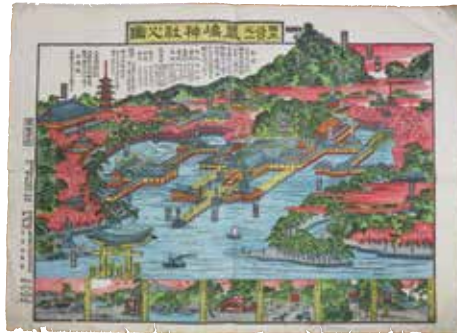
明治28年「日本三景之一厳鳴神社之図」 (個人蔵)