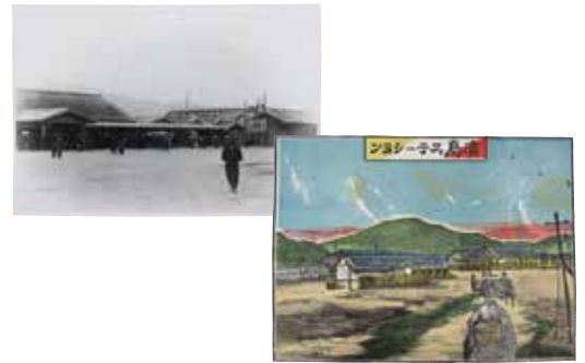
明治期の広島駅 (広島市立中央図書館所蔵)