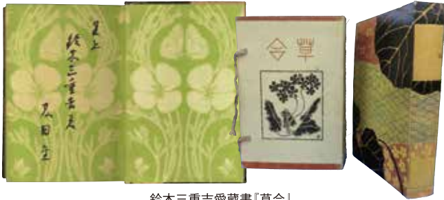
鈴木三重吉愛蔵書『草舎』 夏目漱石／著 (広島市立中央図書館所蔵)