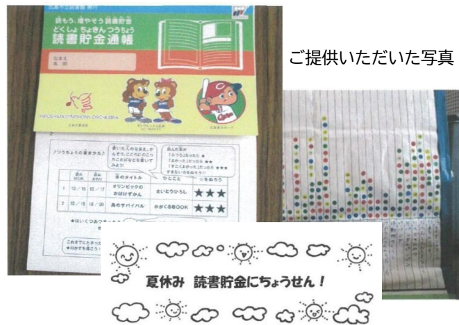
ご提供いただいた写真

「学校・ボランティア等支援図書セット貸出」を利用した方からは、こんな感想をいただいています！