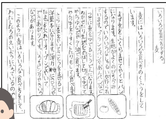
ご提供いただいた学習成果物の写し

国語科「食べ物のみみつを教えます」の学習で自分の興味のある食材について紹介文を書くときの調べ学習用に活用しました。写真つきの本が手元があり、理解が進んだようです（小学校3年）。