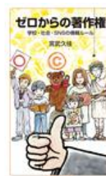
『ゼロからの著作権—学校、社会、SNSの情報ルール』岩波書店