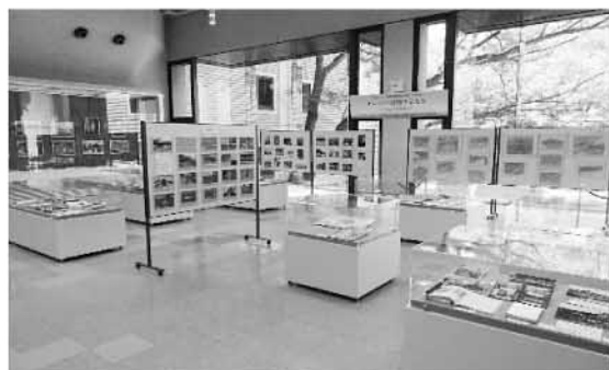
昨年度の 企画展の様子

被爆75周年を迎えるこの夏、核兵器のない世界の実現を訴え続ける被爆者の方たちの思いを受け継ぎ、さまざまな活動に取り組んでいる若者たちの姿から、平和への願いを改めて共有するとともに、平和のバトンを次世代につなげていくことの大切さを考えてみませんか。