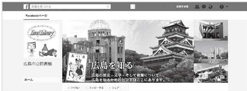
↑ パソコンから見たフェイスブックページのイメージ図

広島市立図書館に関わる次のような情報を、タイムリーにみなさんのお手元へお届けします。ぜひフォローいただき、広島市立図書館をますます活用いただくツールとしてご利用ください。