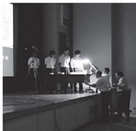
「合同オープンスクール」 市工は銅板折り鶴製作でアピール

そして図書館は学校にも出かけています。25年度は、広島市商ピースデパートに『はだしのゲン』の原画（複製）展示で参加し、市立広島特別支援学校高等部では1年生を対象に「大人になること、働くこと」についてのブックトーク（あるテーマに沿って図書を紹介すること）を実施しました。26年度も、ブックトークだけでなく朝読書などの読書活動推進を支援するため、図書館から積極的に出かけていきたいと考えています。