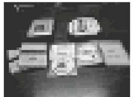
デイジー図書と専用再生機