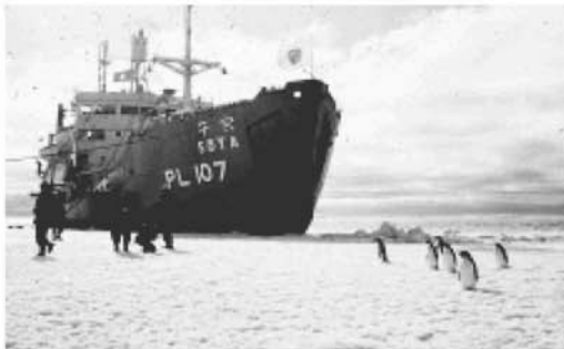
第1次南極観測船「宗谷」

昭和31年(1956年)11月8日、第1次南極観測船「宗谷」は日本中の大人と子どもの大きな夢と希望を乗せて出航しました。未知に挑んだ第1次南極観測隊の壮挙は、忘れていた何かを思い出させ、私たちの胸に熱く迫るものがあります。南極大陸は、人類が理想としている唯一の「国境のない世界」で、南極条約の下、国際協力による観測が進められています。