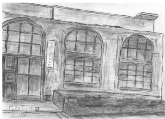
本川小学校平和資料館（本川国民学校）藤登弘郎画

どうぞ被爆建造物があなたへ、世界へ、未来へと発する声なき証言に耳を傾けに展示ホールへお立ち寄りください。広島市の図書館は8月6日(水)も開館しています。