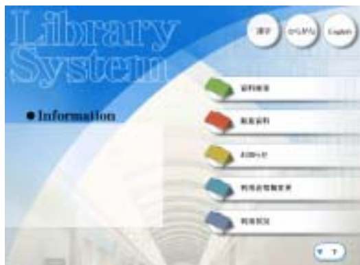
利用者用端末の画面