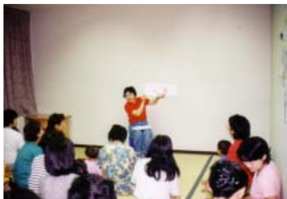
「こぐまちゃんクラブ」のおはなし会の様子 (南区図書館)