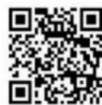
広島市立図書館 ホームページ