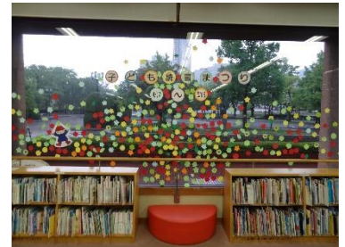
「窓を花でいっぱいしよう」