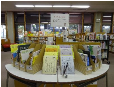
「クイズにちょうせん」