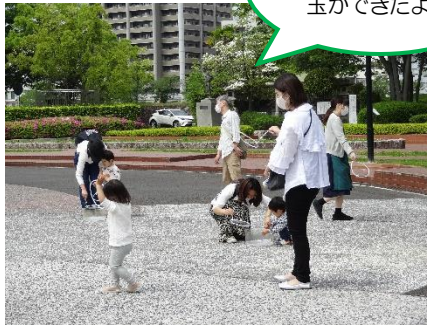
「屋外でのおはなし会」でのしゃぼん玉あそび