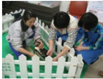
↑やっぱりいちばん人気はペンギンのしゅうくん。