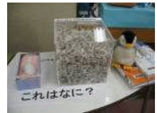
ペンギンの羽(しゅうくん) (こども図書館) ↑

こんにやくいも(こんにやくの原料)や多羅葉(葉っぱの裏に傷をつけると黒くなり字を書くことができるモチノキ科の樹木)やソウメンウリ(割ると中身がソウメンのようになっているウリ)などに、自然に「これ、なに？」と親子の会話ははずみました。